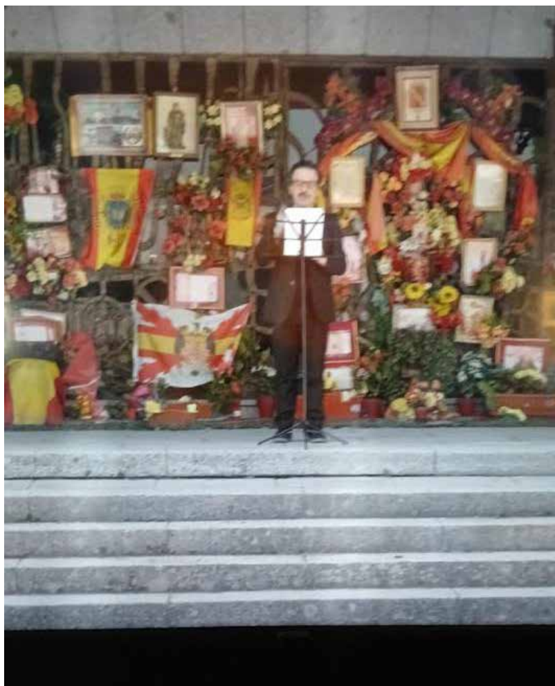
cortesía de MACRO, CCE, Andrés Gabarres