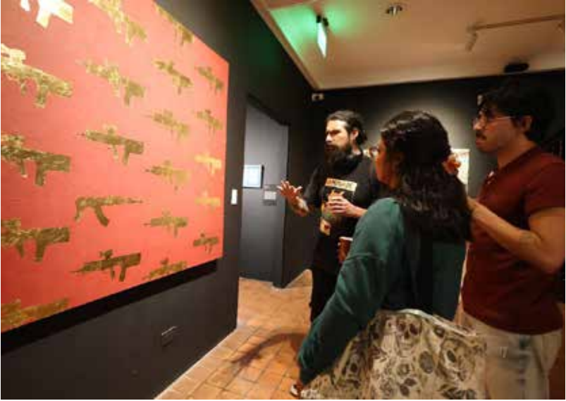
cortesía de MACRO, CCE, Andrés Gabarres