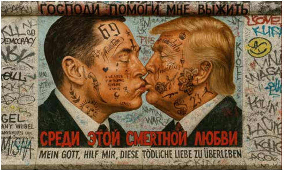
Nelson Díaz Brenes titulada “El beso fraternal / Dios mío, líbrame de este amor tan mortal”, 2025