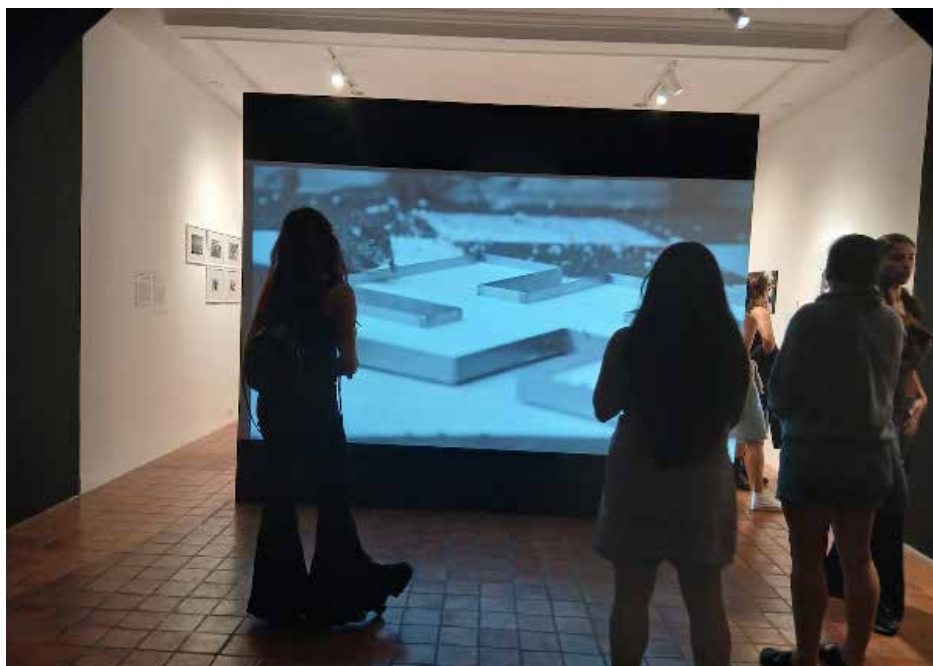
Santiago Sierra / Bebedero/ España