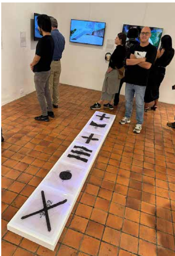
cortesía de MACRO, CCE, Andrés Gabarres