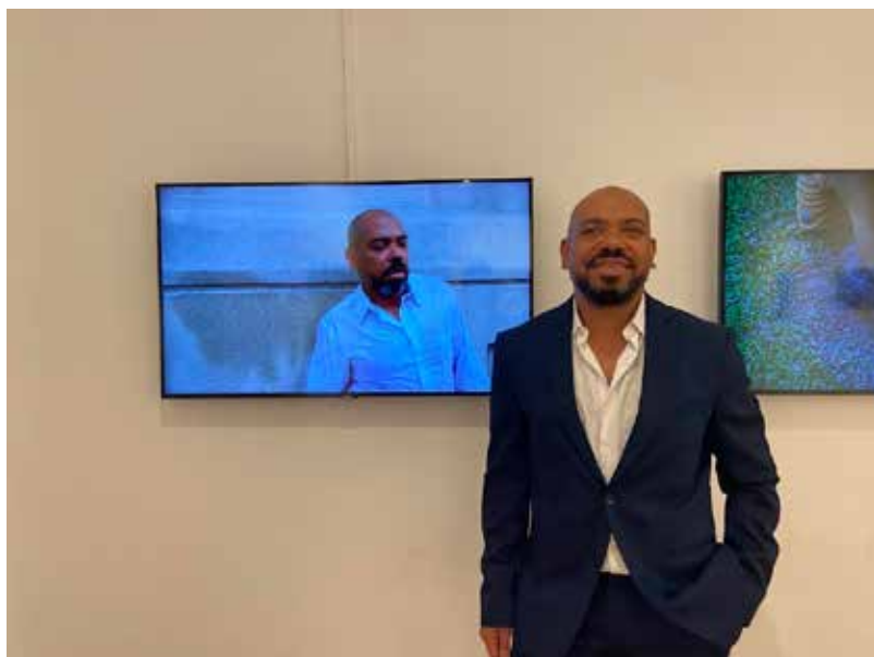
cortesía de MACRO, CCE, Andrés Gabarres